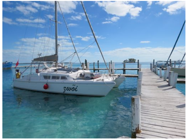
Auf den Bahamas

Ab jetzt ist das Wasser nur noch blau oder türkis. Wir sind in gemütlichen Tagesetappen unterwegs Richtung Süden und treffen einen überwältigenden Ankerplatz nach dem anderen. Die Wassertiefe hier beträgt meistens so um drei Meter, das Eisen fällt sichtbar in feinen Sand und hält jedes Mal auf Anhieb. Zwischenstopp in Nassau . Sechs Kreuzfahrtschiffe stehen hier. Der Ankergrund ist nicht gerade vertrauenserweckend. Die Stadt auch nicht. Die Ausnahme auf den Bahamas in jeder Hinsicht. Auch die Nacht in der West Bay . Wunderschöne Bucht, aber irgendwann steht der Wind vom Land her so, dass die Rauchschwaden der Abfallverbrennung über unser Schiff ziehen. Holy Smoke! Es stinkt im Paradies!