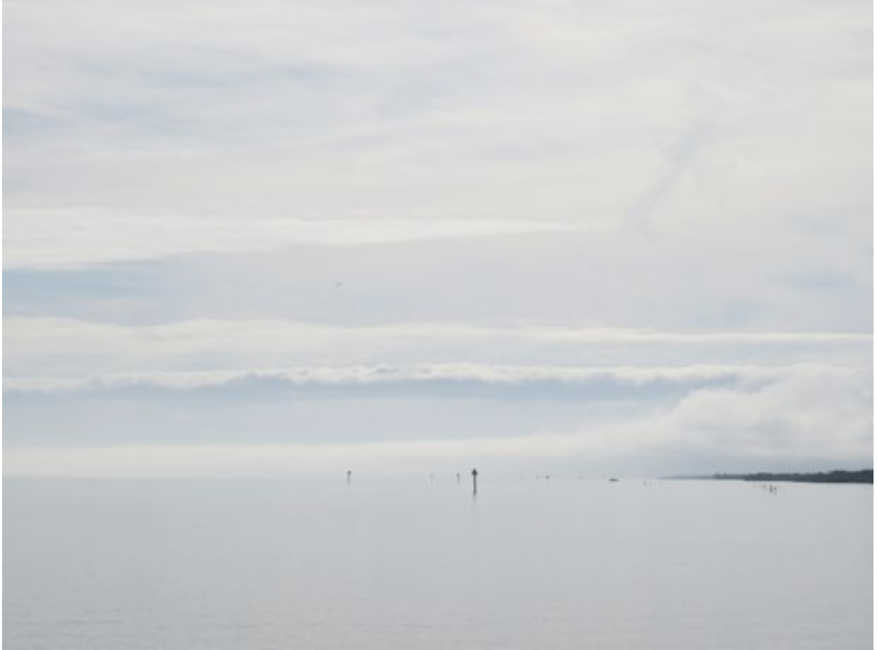
Der Intracoastal Waterway. Manchmal mehr See, als nur Fluss.

Zum Start hatten wir gerade mal 15 Grad Lufttemperatur und bis 20 Knoten Nordwind. Wir schauen also, zügig nach Süden zu kommen, auf dem Intracoastal Waterway bis Miami, um von dort über den Golfstrom auf die Bahamas zu segeln.