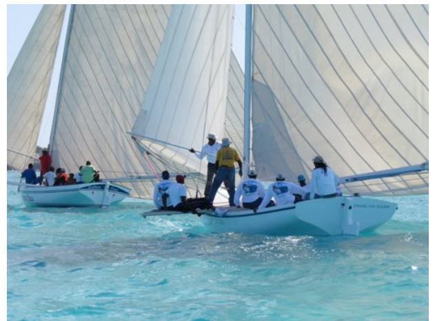
Die National Family Island Regatta....