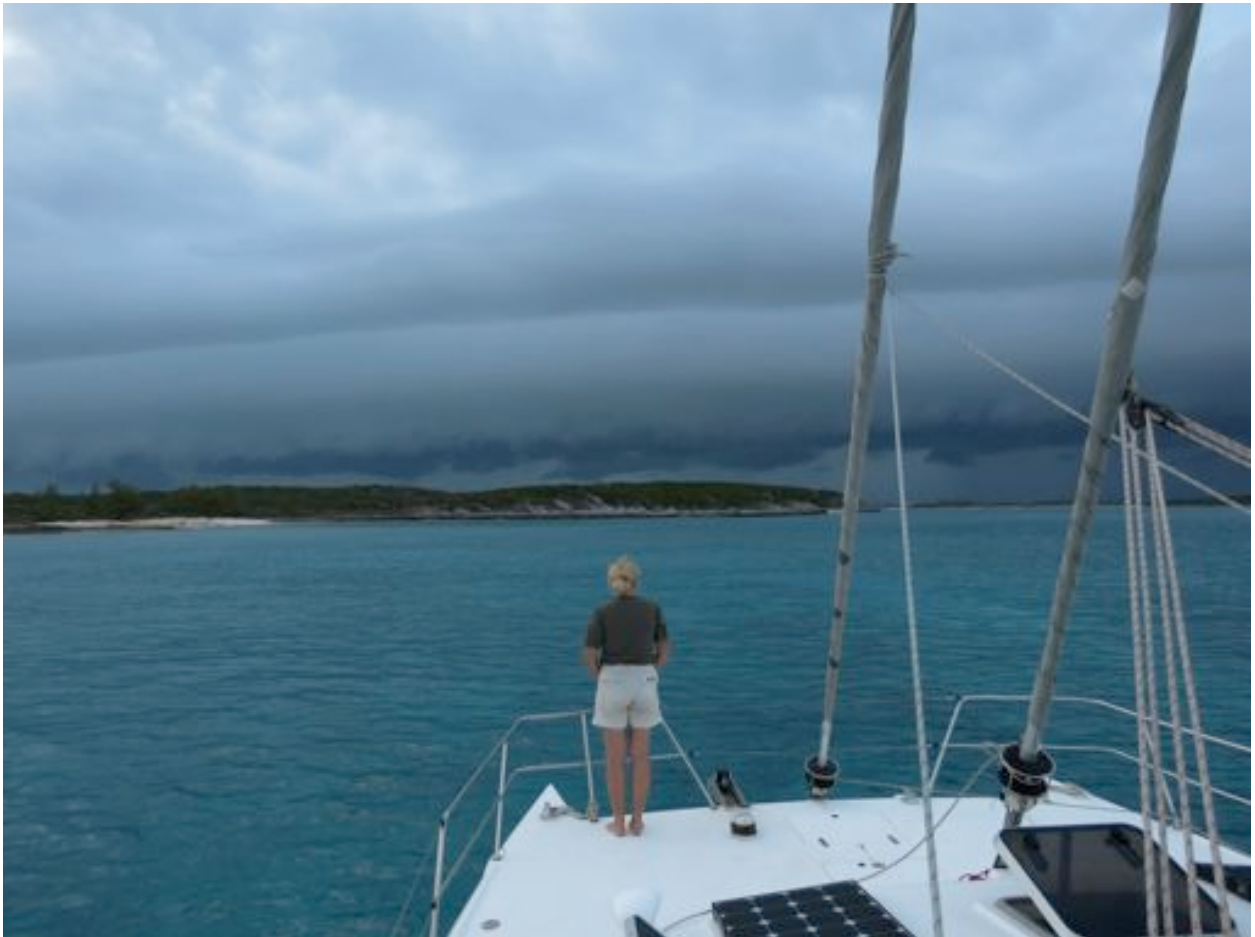
Wie viel Wind ist in der Wolke?

Auf dem Weg nach Süden ziehen immer wieder Fronten aus Norden über uns hinweg, deren zwei pro Woche. Das heisst, wir sind kurz zwischen den Fronten unterwegs und warten dann wieder. Allerdings messen wir nie mehr als dreissig Knoten.