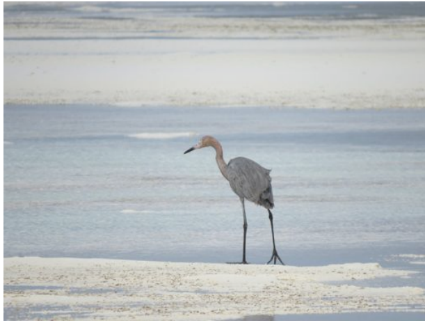
Immer noch Warderick Wells