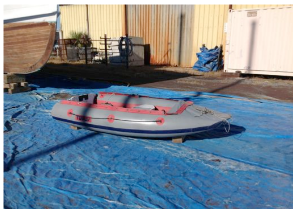
Service an allen Teilen