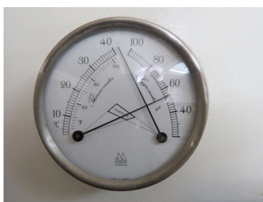
Wenn das Thermometer ansteht.