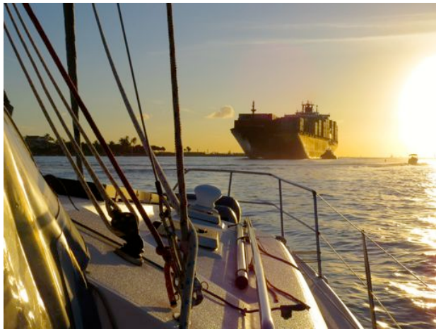
Wer ist stärker?