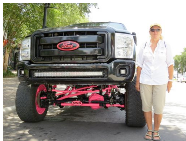
Kühlergrill auf Augenhöhe