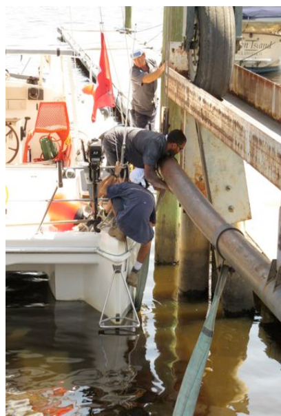
Präzisionsarbeit beim Auswassern. Es hat just gereicht. Kein Belag am Unterwasser!