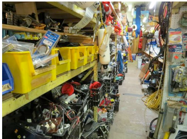
In St. Augustine gibt es einen Secondhand – Schiffszubehörladen. Da schlägt das Bastlerherz höher...