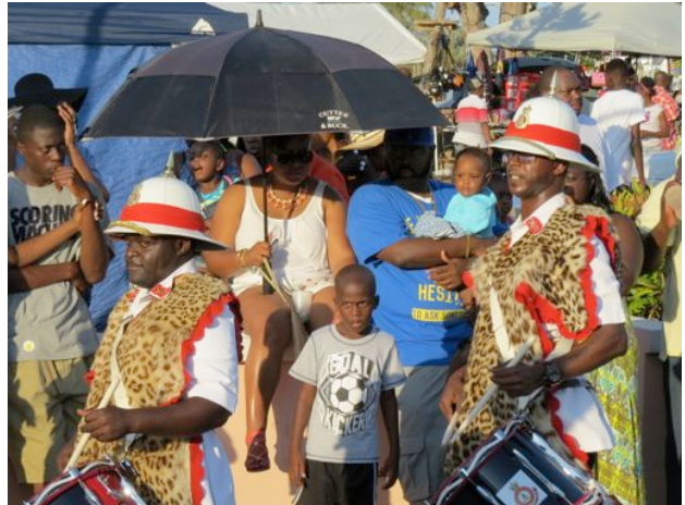
.....und deren Aktivitäten an Land.