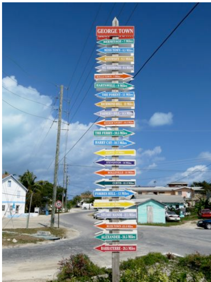
Es führt kein Weg nach Rom.

Zwei Regattaveranstaltungen gab es, während wir hier waren. Die erste war für die hier vor Anker liegenden Schiffe, einmal rund um Stocking Island , die andere und vor allem interessantere und sehenswertere war die Family Island Regatta , wo die Einheimischen mit ihren selber gebauten offenen Holzbooten gegeneinander antreten. Wer mehr darüber wissen möchte, geht auf www.nationalfamilyislandregatta.com . Und weil einem manchmal einfach die Worte ausgehen, nachfolgend ein kleiner Bilderbogen.